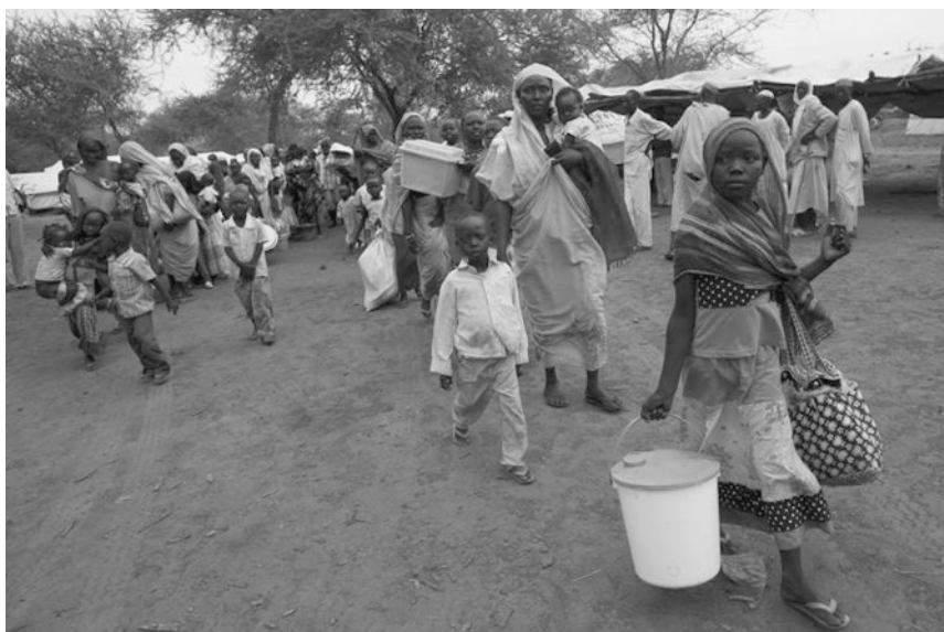
Южно-суданские беженцы в лагере Jamat , расположенном недалеко от границы с Суданом.

Развивая эти мысли, некоторые независимые наблюдатели сегодня обозначают версию, по которой поддержание управляемого конфликта в Южном Кордофоне и других спорных районах, особенно в районе Хеглиг, создало для правительства Омара аль-Башира крайне невыгодные условия. Безусловно, прекращение поставок южно-суданской нефти экономически невыгодно и Южному Судану, перед правительством которого также стоят очень сложные задачи строительства